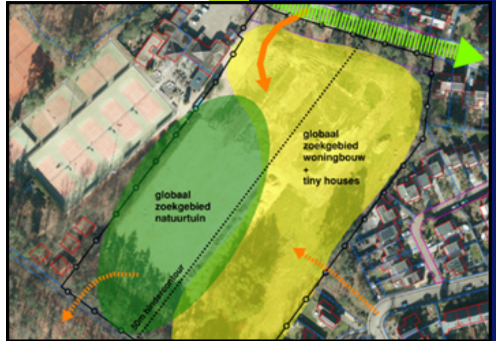
Figuur 1: Locatie Admiraal Helfrichlaan te Dieren

Door de realisatie van de woningbouw wordt een dekkende grondexploitatie verwacht. De hoogte van het resultaat is afhankelijk van hoeveelheid en type woningen die gerealiseerd kunnen worden en de kosten.